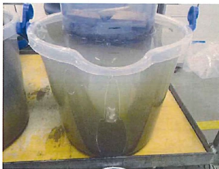
逸水層の透水後にこり状況

以上の実験の結果、逸水が認められる地盤上で地盤改良を行うに当たり、エルニード工法特有の掘削後に泥水によって被膜層を構築する方法は、自然地盤(逸水層)の透水係数に対して、目詰まりさせることが可能であり、透水性を大きく低下させることができる有効な工法と考察される。