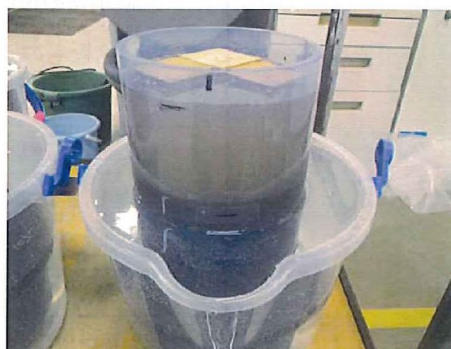
泥水被膜後の透水試験中