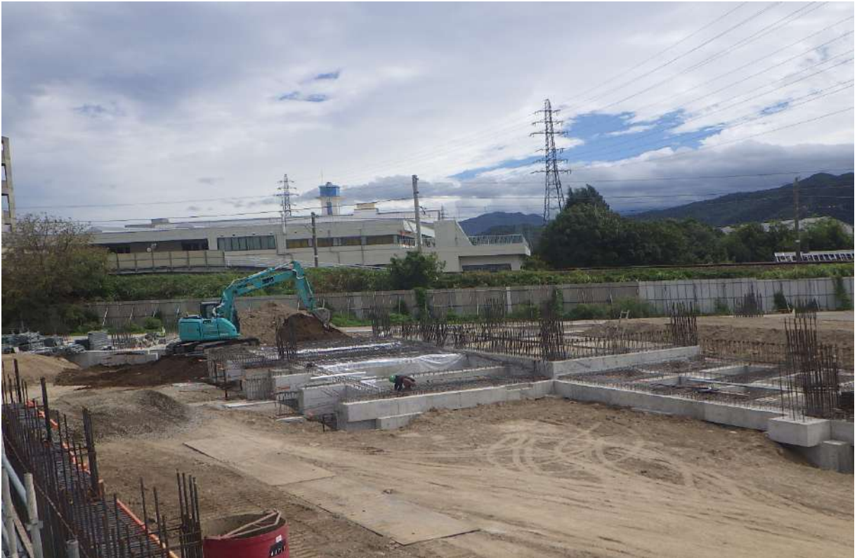
・ランプウェイ支保工②