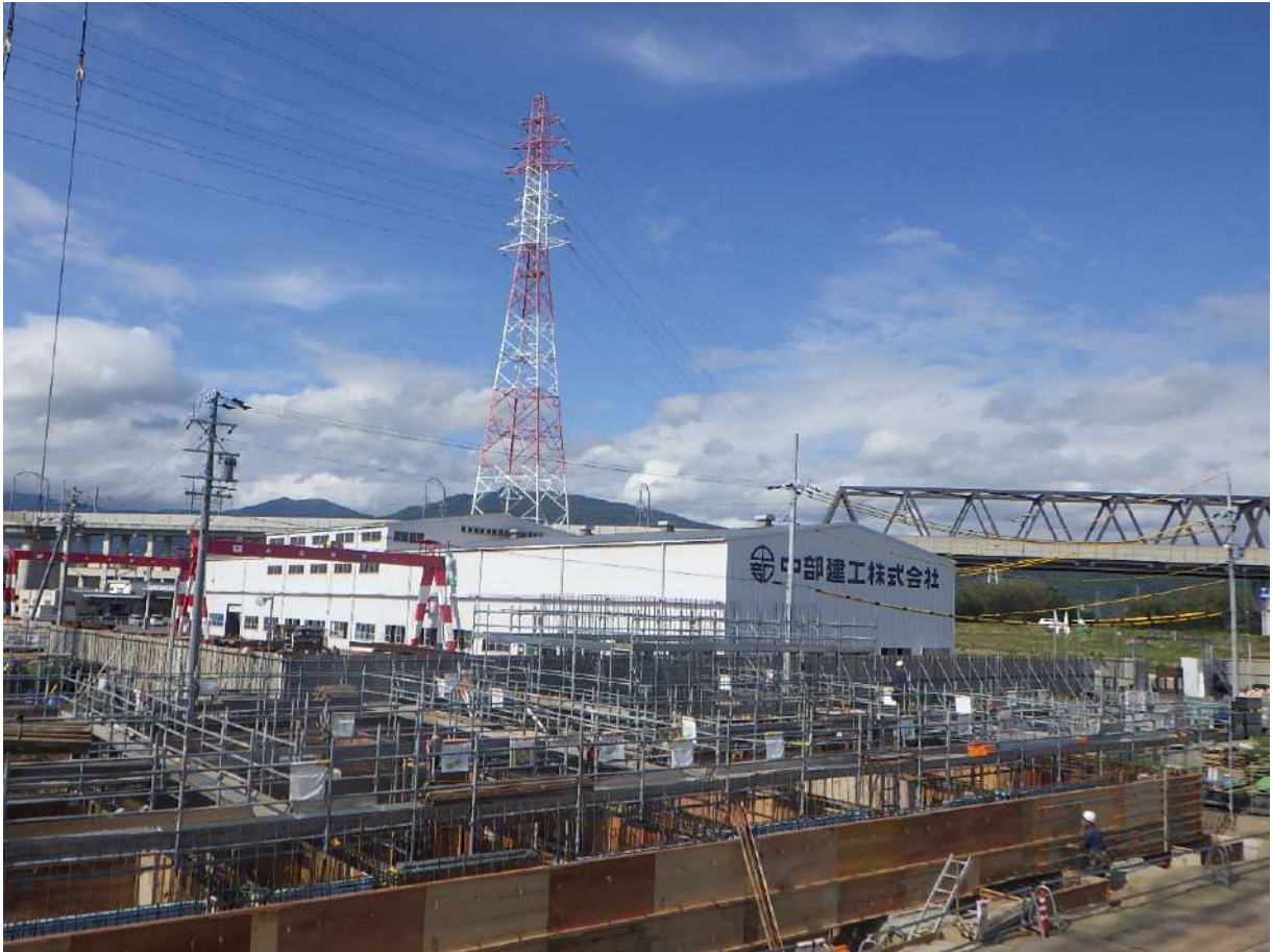
・管理棟根伐工事