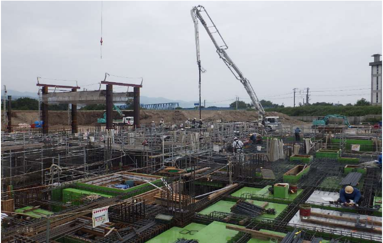
・ B,C 工区鉄骨工事