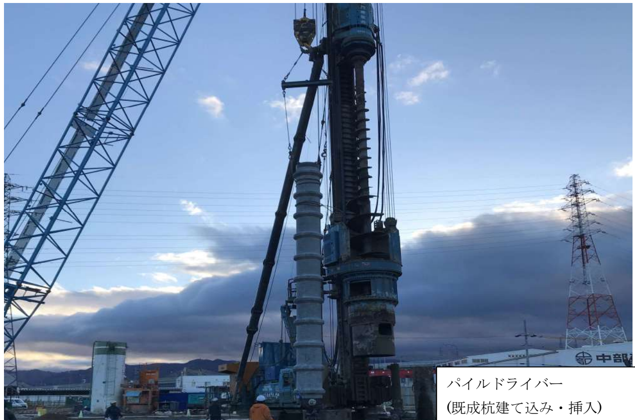
パイルドライバー (既成杭建て込み・挿入)