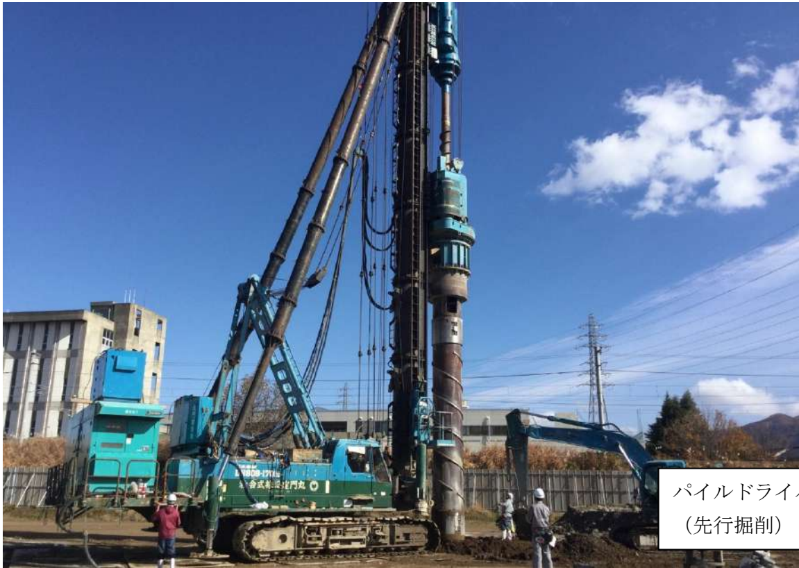
パイルドライバー (先行掘削)