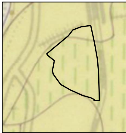
扇状地 FV Fan FV

対象事業実施区域及びその周辺では、地形分類図で見ると全域が扇状地である。また、表層地質図で見ると礫がち表土である。