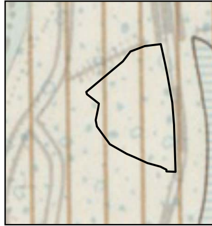
礫がち表土 Gravel-rich subsoils