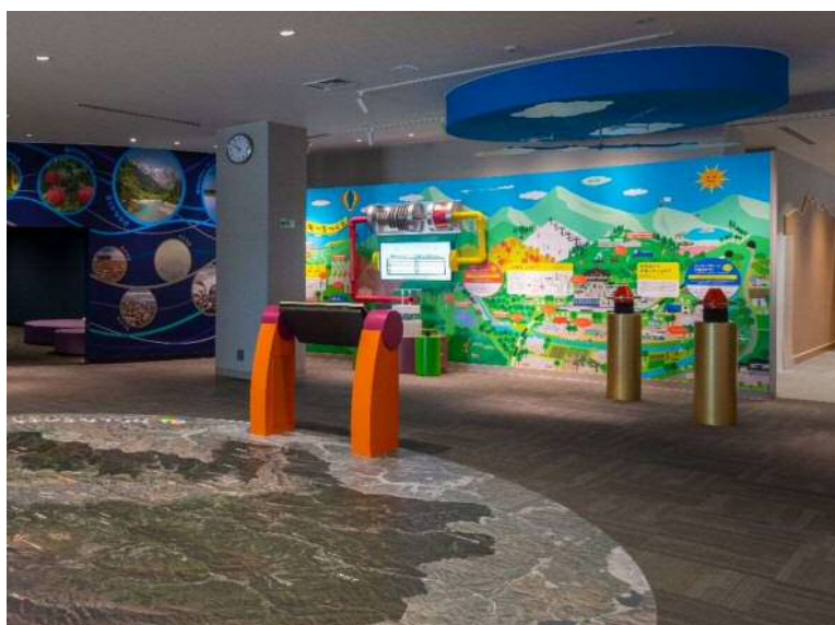
プラント工事(情報発信設備)2月