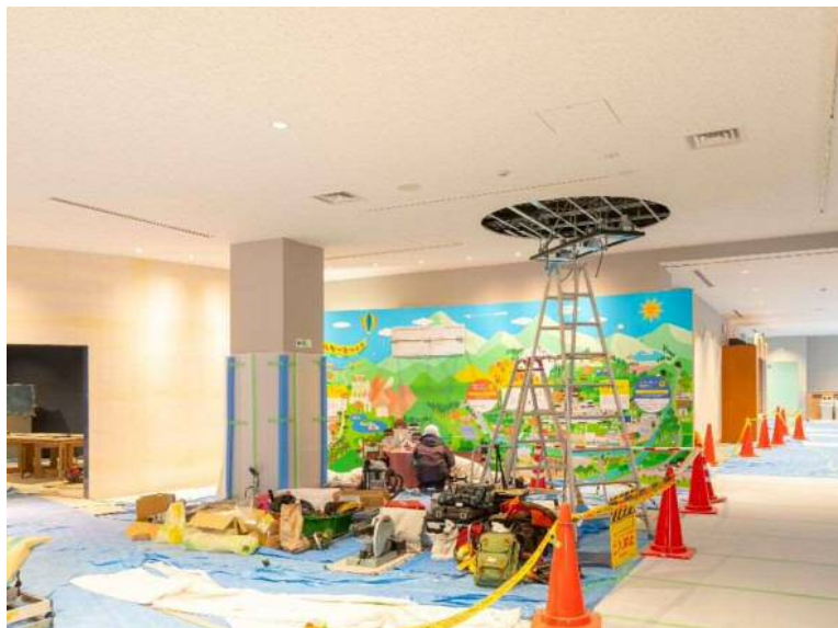
プラント工事(情報発信設備)1月