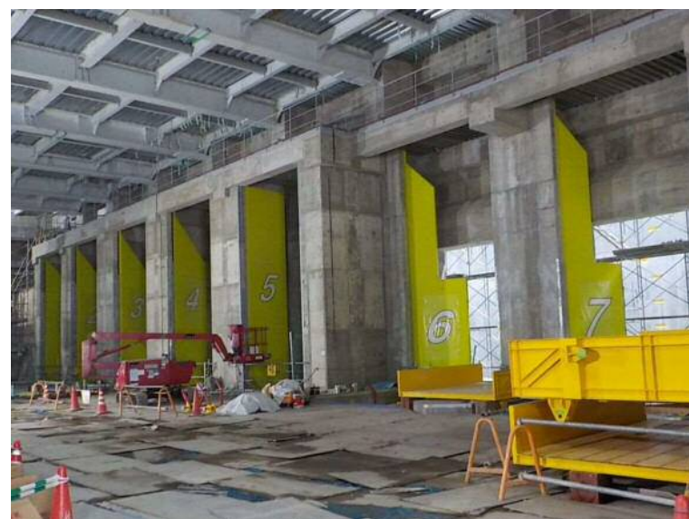
プラント工事(投入扉取込)