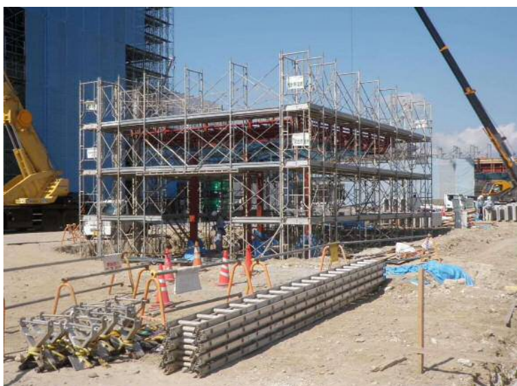
管理棟等工事(計量棟①)