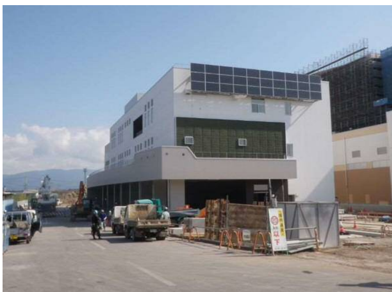
管理棟等工事(管理棟)