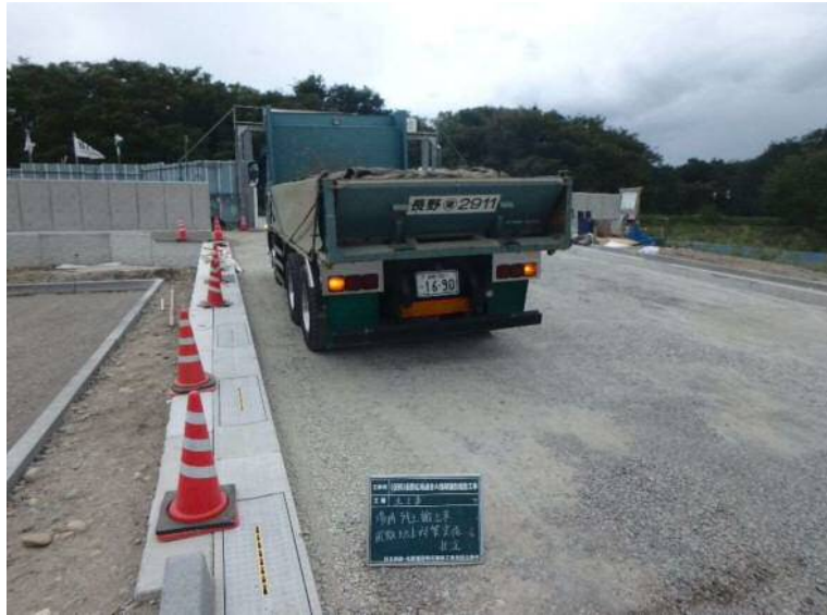
外構工事(土砂搬出状況)