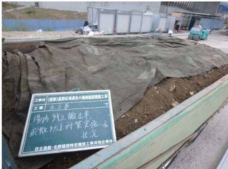
外構工事(土砂搬出状況)