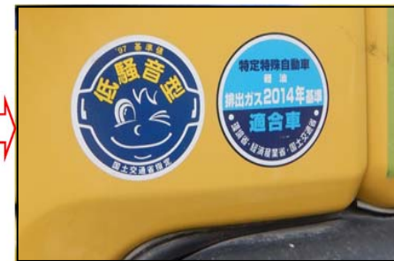
排ガス対策型・低騒音型建設機械