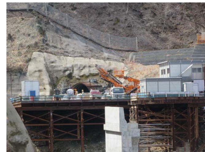
③トンネル本坑準備工