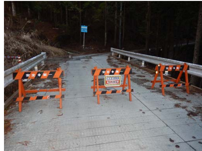
工事現場への立ち入り禁止柵