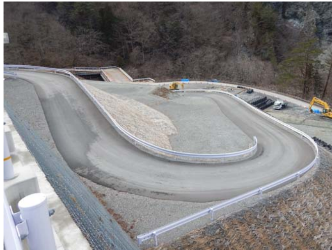
工所用道路の仮舗装