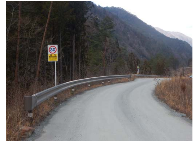
規制速度・走行速度の明示