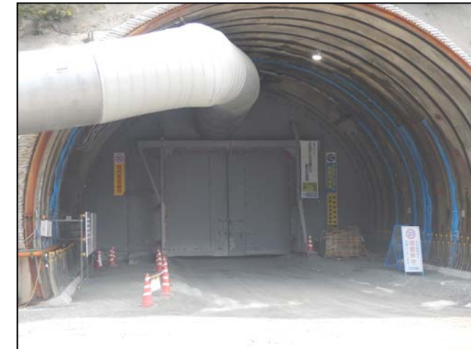
トンネル坑口 防音扉の設置