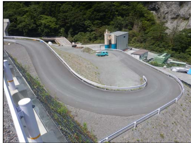
工事用道路の仮舗装