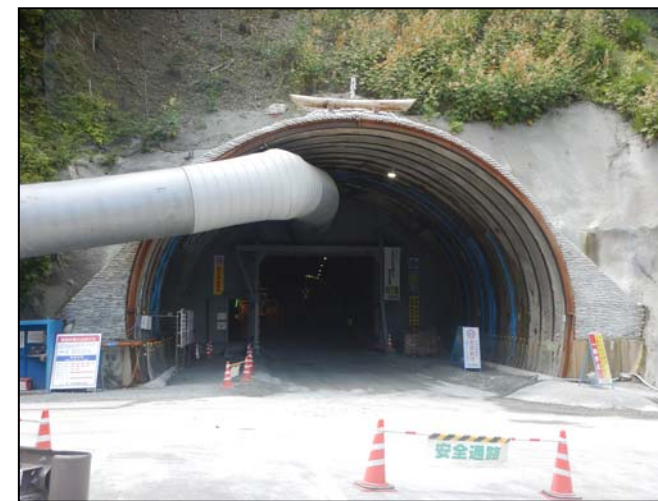
②トンネル本坑坑口