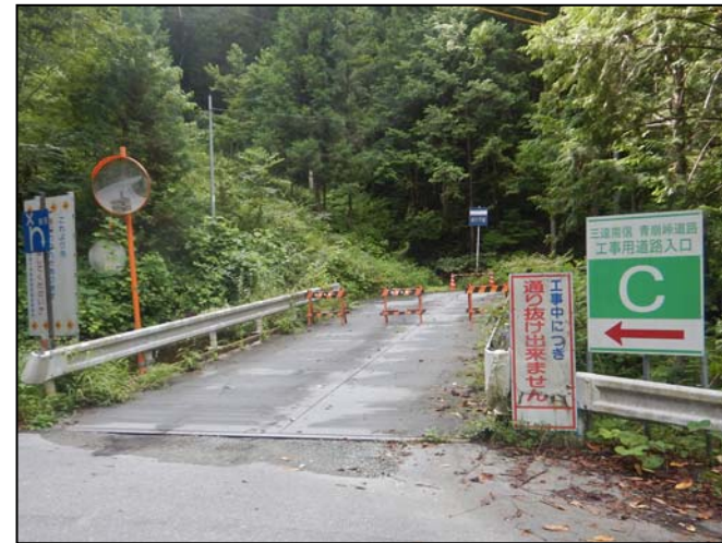
工事現場への立ち入り禁止柵