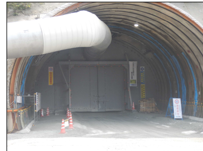
トンネル坑口 防音扉の設置