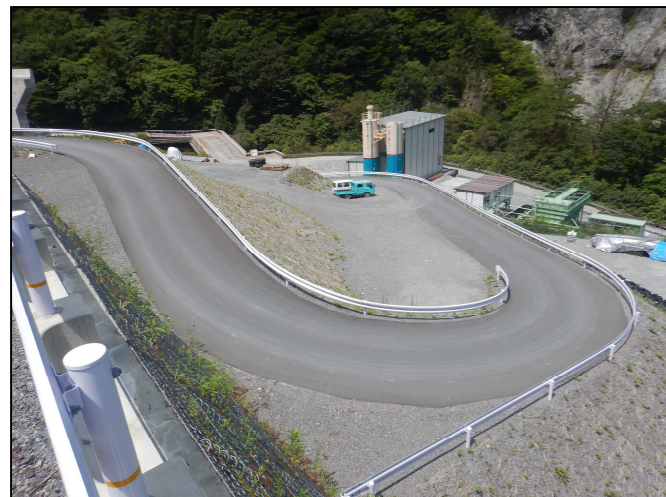
工所用道路の仮舗装