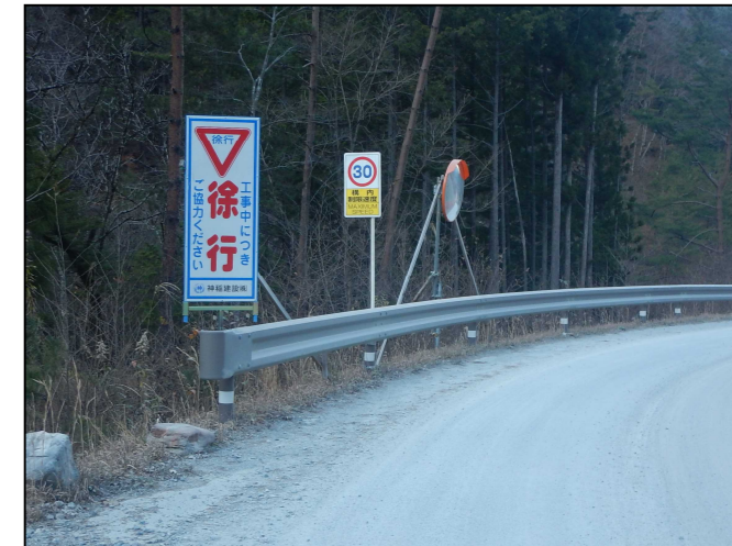
規制速度・走行速度の明示