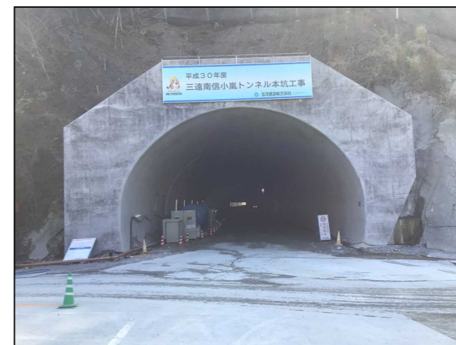
②トンネル本坑坑口