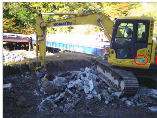
排ガス対策型・低騒音型建設機械