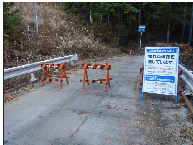
工事現場への立ち入り禁止柵