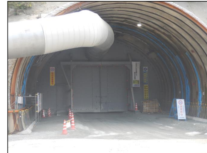
トンネル坑口 防音扉の設置