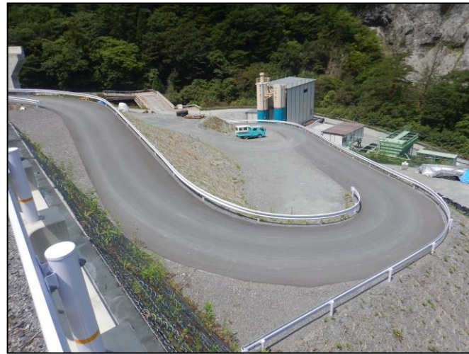
工所用道路の仮舗装