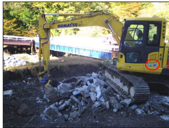
排ガス対策型・低騒音型建設機械