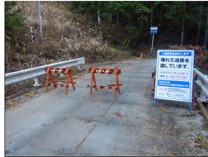
工事現場への立ち入り禁止柵