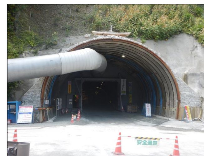
②トンネル本坑坑口