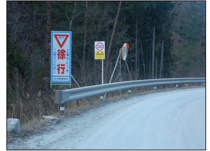
規制速度・走行速度の明示