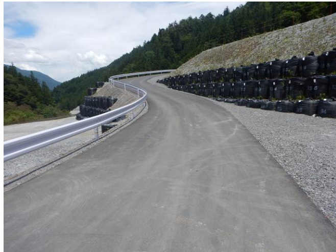
工事用道路の仮舗装