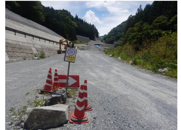
規制速度・走行速度の明示