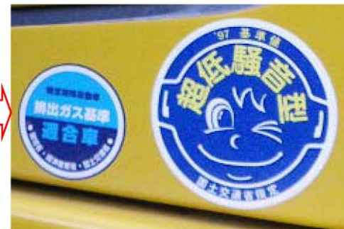
排ガス対策型・低騒音型建設機械