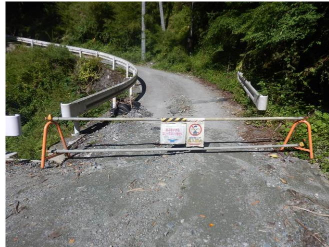
工事現場への立ち入り禁止柵