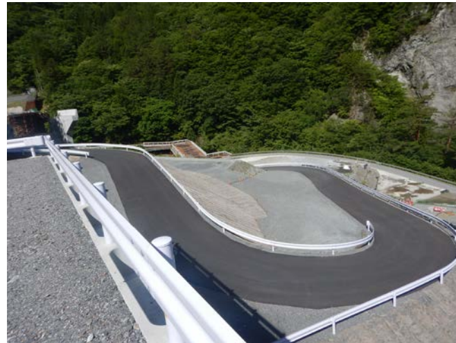
工所用道路の仮舗装