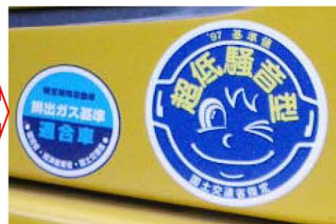
排ガス対策型・低騒音型建設機械