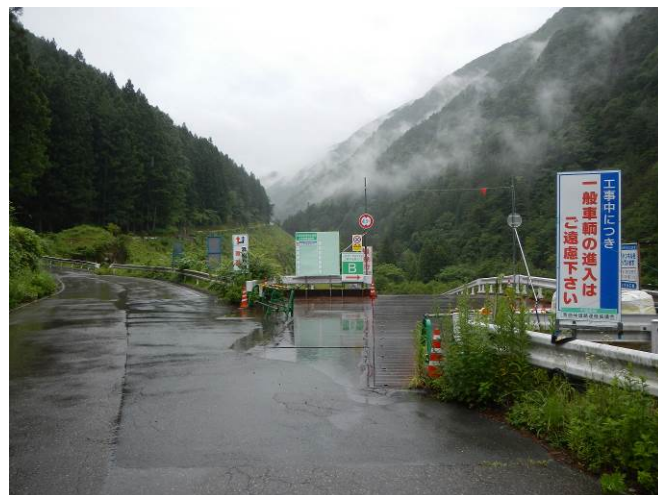
工事現場への立ち入り禁止柵