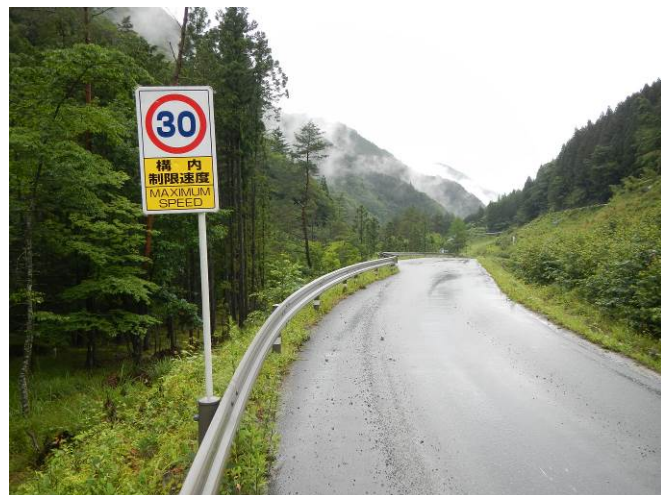
工所用道路の仮舗装