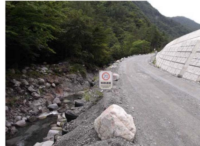
規制速度・走行速度の明示