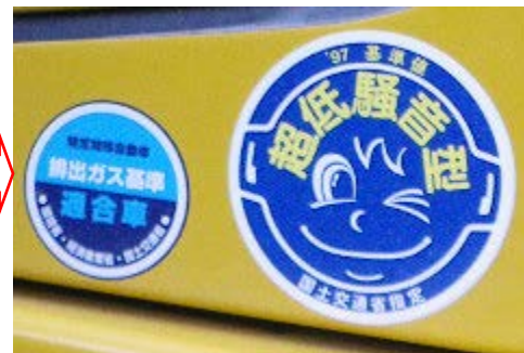
排ガス対策型・低騒音型建設機械