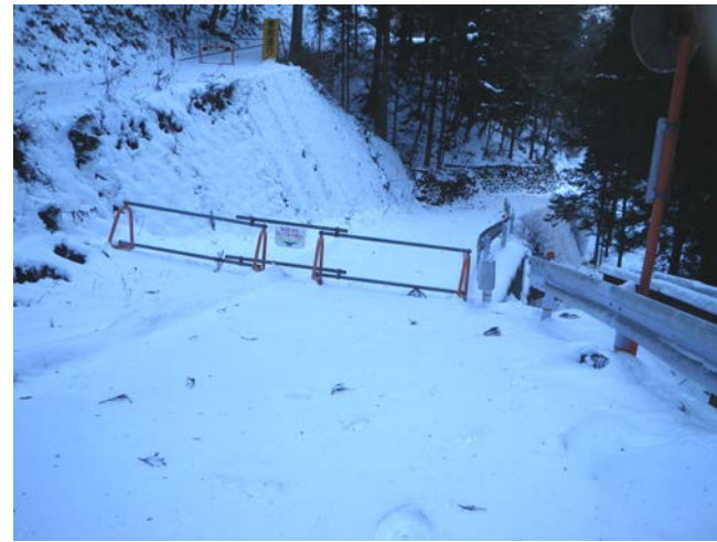
工事現場への立ち入り禁止柵