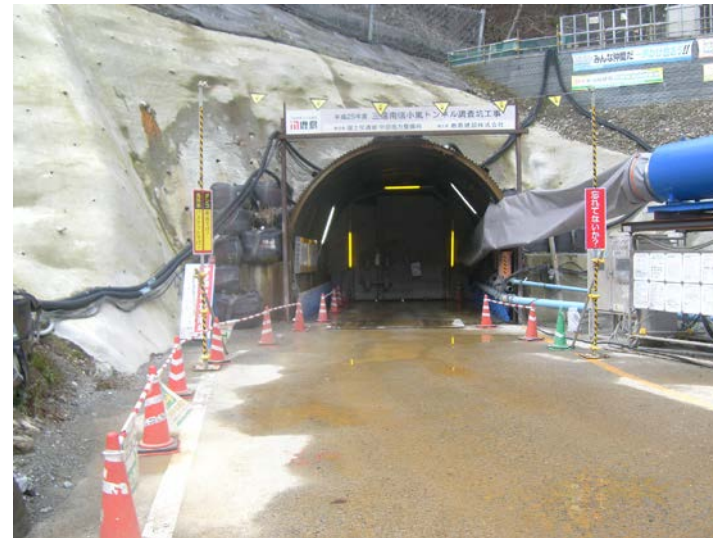
トンネル坑口 防音扉の設置