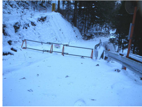
工事現場への立ち入り禁止柵