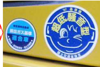
排ガス対策型・低騒音型建設機械