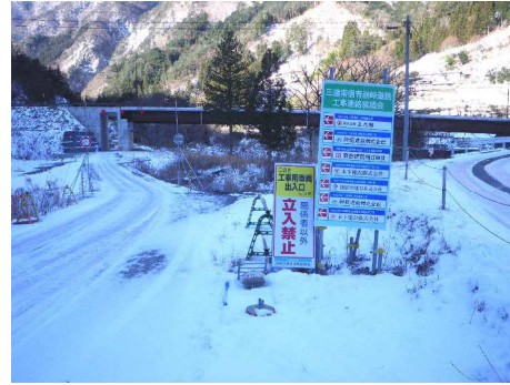
規制速度・走行速度の明示