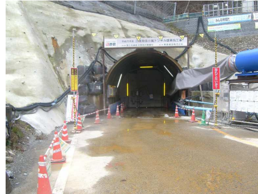
トンネル坑口 防音屏の設置