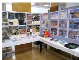
沖縄県×長野県 共同企画