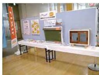
長野市スマート ハウス化応援隊