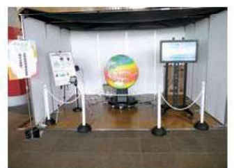
長野県環境保全協会 〈触れる地球〉