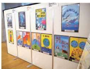
ポスターコンクール 最優秀・優秀作品

また、長野市役所市民交流スペースでは、当県民会議主催のポスターコンクール最優秀・優秀作品の展示のほか、長野市スマートハウス化応援隊、沖縄ならではの自然や海洋プラスチックなど環境問題について紹介する「海なし県に美ら海がやってきた!? ～沖縄県×長野県共同企画～」、デジタル地球儀で環境について楽しく学べる「長野県環境保全協会〈触れる地球〉」の展示を行いました。