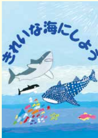
2020(令和2年度) 小学生・低学年の部 最優秀作品