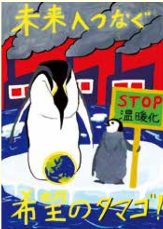
2019(令和元年度) 小学生・高学年の部 最優秀作品