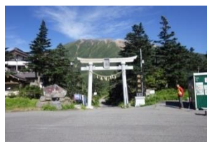
王滝口の大鳥居（田の原）