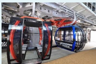
自然換気システムでキャビン内を常に換気 (野沢温泉スキー場)