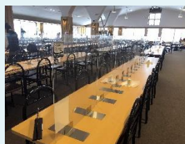
レストランは飛沫防止対策を徹底 (戸隠スキー場)