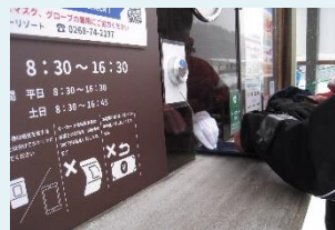
リフト券売場にパーテーション設置 (菅平高原スノーリゾート)