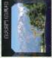
白馬湖の雄大な湖と山並み アルプスの雄大な湖と山並み