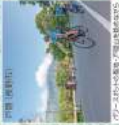
アルプスから眺める雄大な山並みと谷間の風景が最高