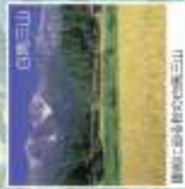
白馬三山 雄大な山並みと谷間の風景が最高