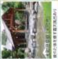
白馬湖の雄大な湖と山並み アルプスの雄大な湖と山並み