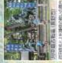
川中島古戦場(長野市) 戦国時代の上田城跡の観光地