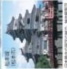
松本城 雄大な山並みと谷間の風景が最高