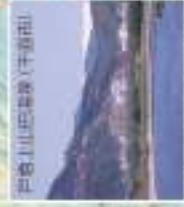
戸倉山荘温泉(千曲市) 戸倉山荘温泉は温泉・公園で有名な