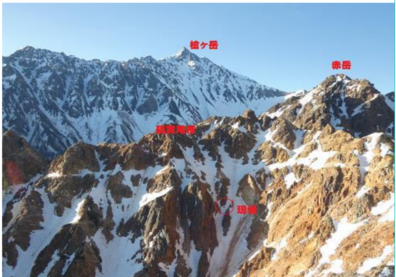
上記の(槍ヶ岳に近い)北アルプス赤岳の硫黄尾根の遭難現場