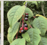
ウワミズザクラ Japanese Bird Cherry