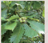
ミズナラ Japanese oak