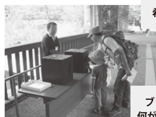
ブラックボックスクイズ。 何が入っているでしょうか？