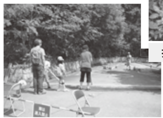
コロコロダンゴムシゲーム

飯綱庁舎の敷地と館内を利用して、飯綱高原の自然などに関するクイズやゲームにチャレンジしてもらいました。最後までがんばった人には「飯綱しぜん博士」の認定証をさしあげました。また、得点の合計が高かった上位の方々にはちょっとお得な賞品もプレゼントしました。