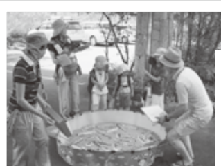
大人気！魚釣りゲーム。 希少種を保護できるかな？