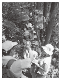
敷地で散策。エコクイズラリー