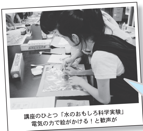
講座のひとつ「水のおもしろ科学実験」 電気ので絵がかける!と歓声が

施設公開も親子環境講座も、私達の仕事を県民の皆様にはアピールできる貴重な機会です。せっかく見てもらうのだから、来年も来たい!と思ってもらいたい。というわけで知恵を絞って企画しました。