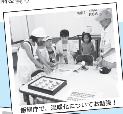
飯綱庁舎で、温暖化についてお勉強!

飯綱高原にたたずむ飯綱庁舎では、ゆたかな自然を満喫し、なおかつ学べる企画がもりだくさん。里山を見ながら飯綱高原まで歩いて登る特別企画も好評でした。