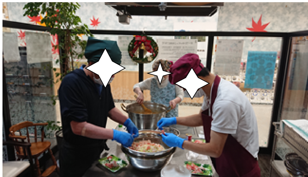
オープンキッチンは1回600円。日頃どんな集まりでも使用できるキッチンです。(要連絡)