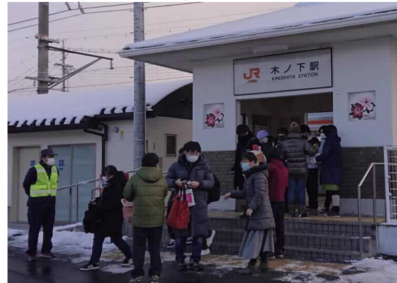
朝子ども食堂（毎月第二・四水曜日の朝）は、登校時の地元高校生の朝食支援として、木下駅前で手作りおにぎりを無料で配布しています。