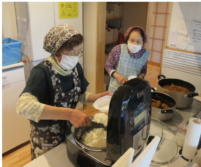
地域のボランティアの皆さんお手製のカレーライス！

利用者へのPR お友達同士やご近所さんで誘い合ってお越しく下さい！現在は新型コロナウイルス対策でテイクアウトにしていますが、いずれまた会場で一緒に食事の時間を楽しみたいと考えています。