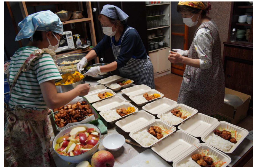
地元のお米や野菜をたくさん使い、多い時は100食程作ります。この日は地元の農家さんからぶどうやりんごがたくさん届きました。