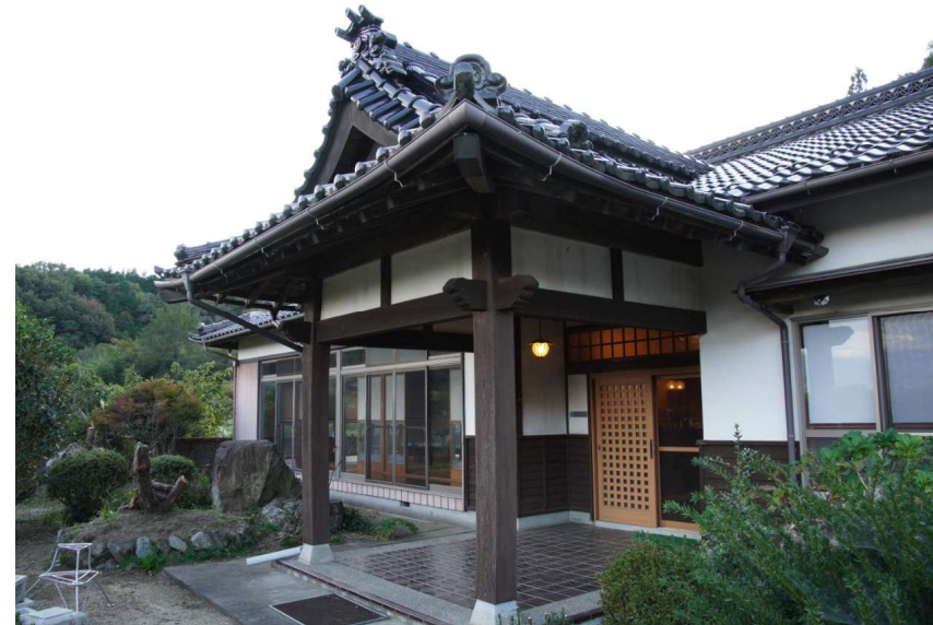
会場の大きな古民家。庭も広く、子どもたちが思いっきり走り回れます。