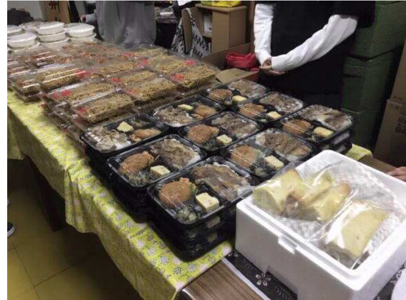
放課後子ども食堂（毎月第2・4金曜日）は、コロナ禍のため、テイクアウトでお弁当やカレーライスを配布。子どもから高齢者まで地域のつながりの場になっています。