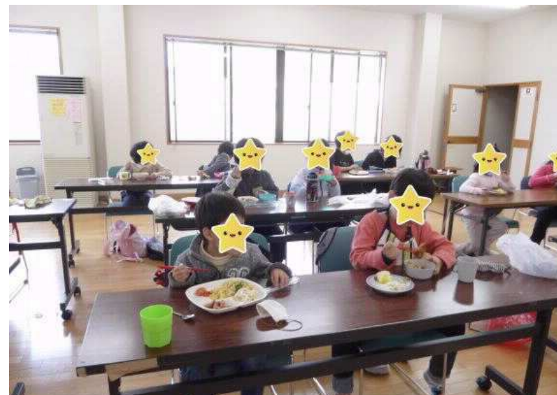
感染症予防に配慮し昼食をとります。