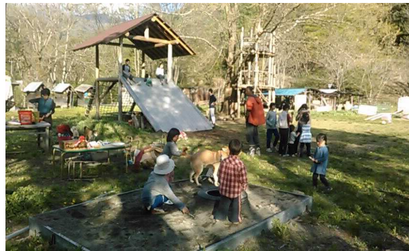
<子ども大人も犬も自由に遊んでいます>