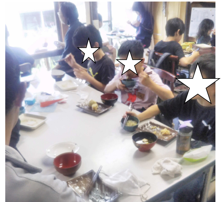
【みんなで食べるご飯はおいしいね】