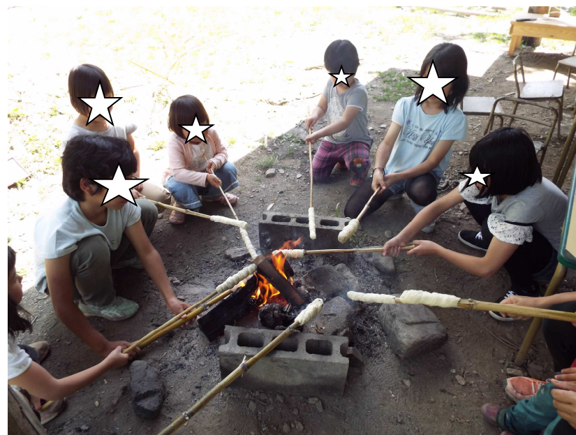
<たき火でパンを焼いています>