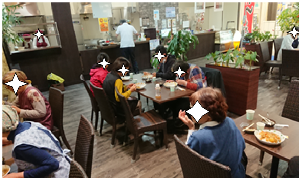
ひとりでも、誰でも、誰とでも来ていい「ヒュッグみのわ〜れ」を目指します!