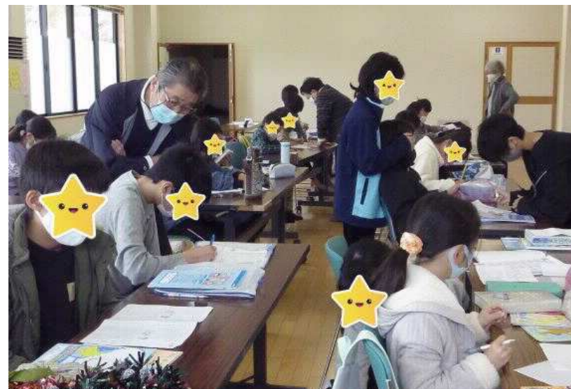
10時から学習支援。先生に見守られて机に向かいます。

利用者へのPR 楽しく元気に！友達と仲良く遊ぼう。おいしい昼食を用意します。 困ったときの自立生活支援、あかりサロン（ミニデイサービス）、配食弁当（火 水木金）、オレンジカフェ、いきがいつくり事業、様々な事業を実施していま す。あかり（共生館あさひヶ丘）へ出かけて下さい。