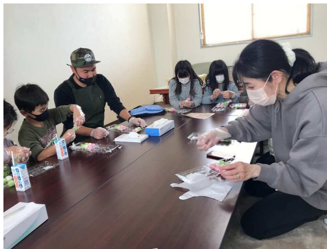
子ども食堂だけでなく、ワークショップを行っています。三食団子をすみっこぐらしのお団子に可愛くアレンジしています。皆真剣!!