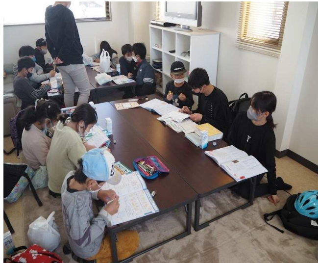
春休みや長期休み、お留守番をしている地域の子もたちが集まり休み帳を皆でやりました!