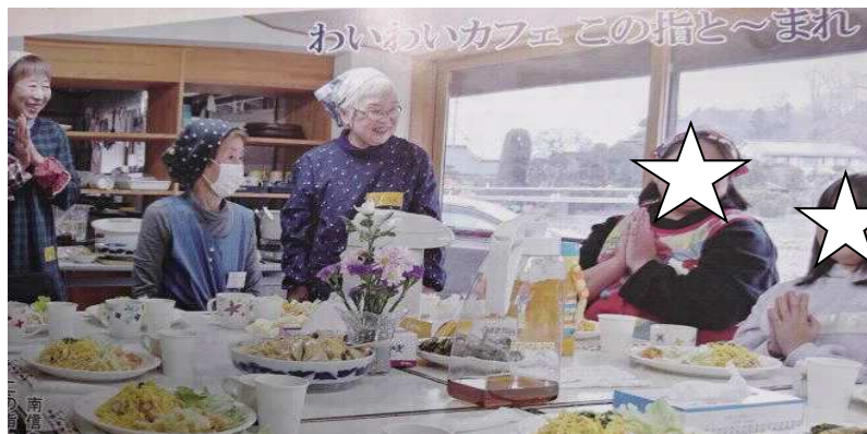
この日は錦糸たまごたっぷりのちらし寿しメニュー 子どもさんもお手伝いをしました (コロナ禍以前のランチタイム)

利用者へのPR どなたでも参加いただき、安心安全な食材を使用したランチを食べながら わいわい・ガヤガヤおしゃべりしたり、レクリエーション・ゲームなどを ご一緒に楽しみましょう！(コロナ禍のもと、当面はお弁当の配食のみ)