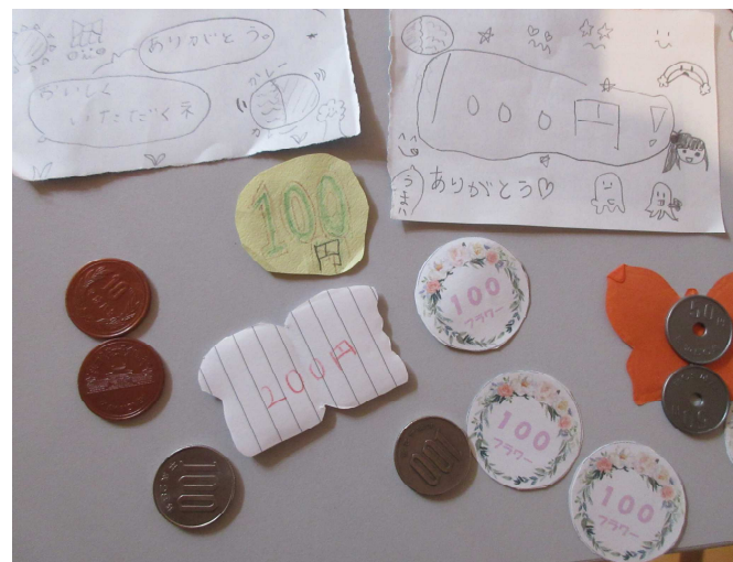
子どもたちからの、かわいらしい手作りコインなど