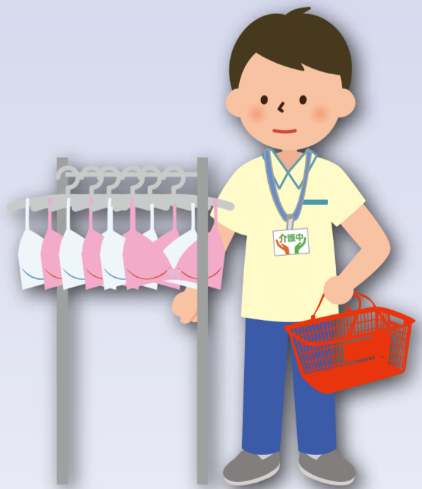
男性介護者が女性用下着を 購入する時