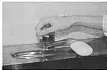
7. 水道の栓を止めるときは、手首が肘で止める。できないときは、ペーパータオルを使用して止める