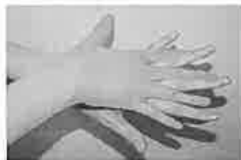
2. 手の甲を伸ばすように洗う