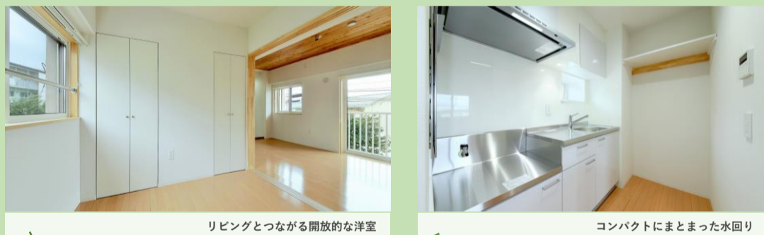
リビングとつながる開放的な洋室