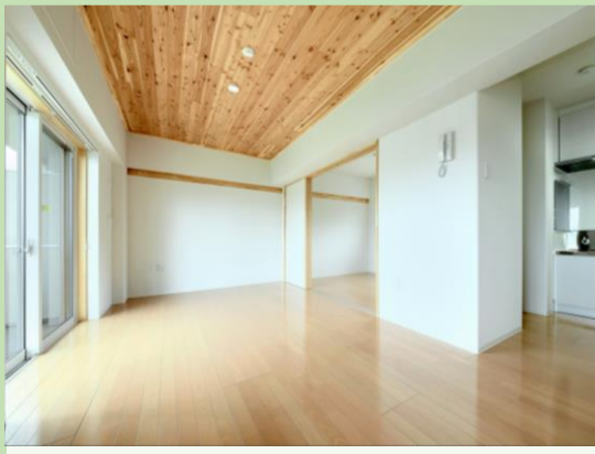
家族団らんができる広いリビングダイニング