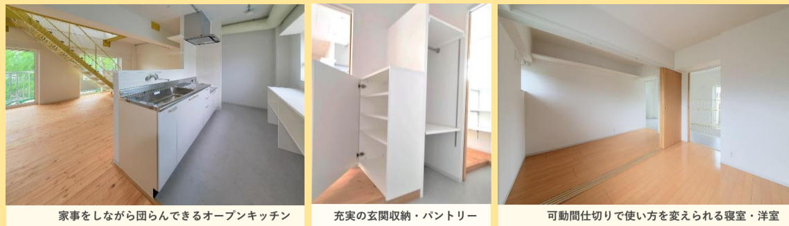
家事をしながら囲んでできるオープンキッチン