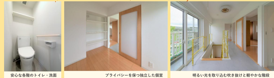
安心な各階のトイレ・洗面