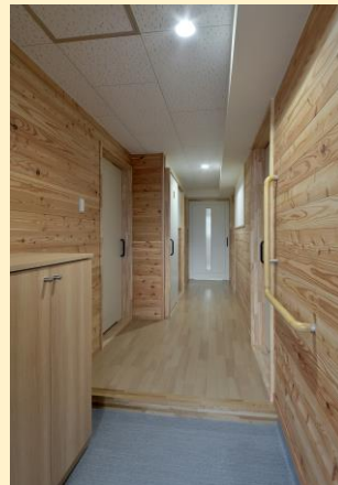
県産カラマツの壁 玄関・廊下(2号棟)