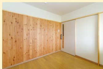
住戸内の県産カラマツ壁