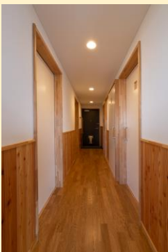
県産カラマツの腰壁 玄関・廊下(A-2棟)