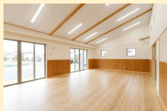
集会室 県産カラマツの腰壁と床板