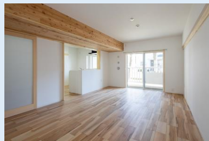
天井梁型部分の県産カラマツ板張り 【県営住宅笹部弥生団地(松本市)】