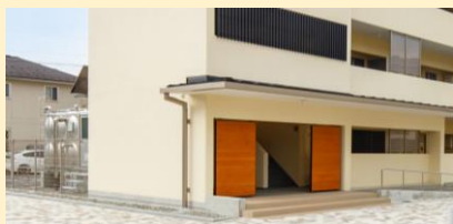
7号棟入口部の県産カラマツの 掲示板