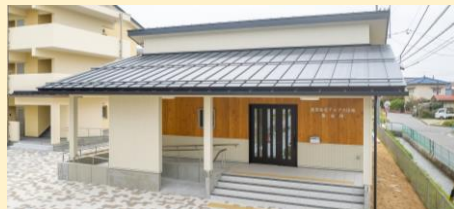
集会所正面の県産カラマツ壁