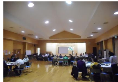
《第3回(H30.12.17 別所温泉) 【会議】》