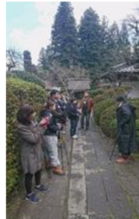
《第3回(H30.12.17 別所温泉) 【実践・体験、視察】》