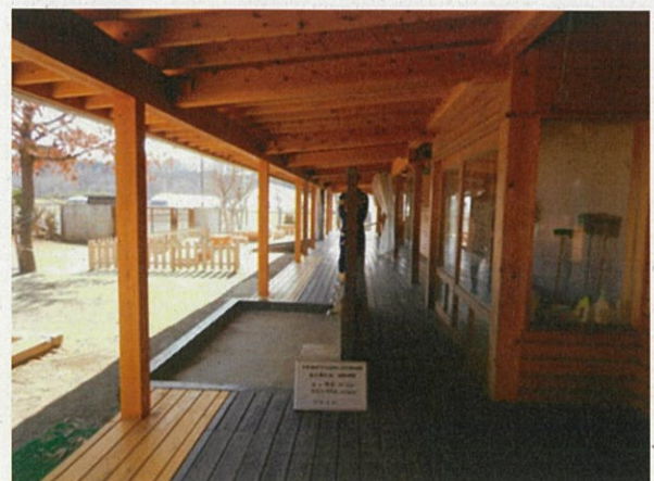
増 築 後