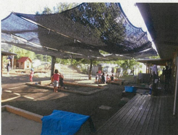
増築前 (寒冷紗で日陰を確保)