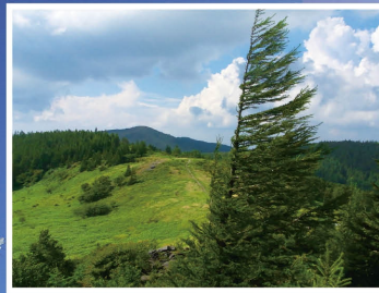
美ヶ原高原カラマツ扇形樹(美ヶ原高原)