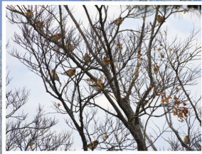
アドリ(菅平高原・美ヶ原の北麓・美ヶ原高原・千曲川周辺)