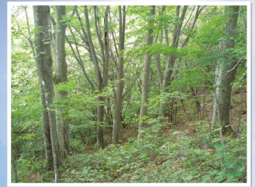
大洞ブナ林(菅平高原)