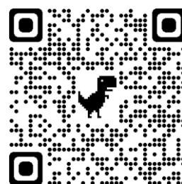
長野県発達障がい情 報・支援センターHP