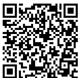
LD のある子に対する支援 ～早めの気づき適切な学び ～リーフレット