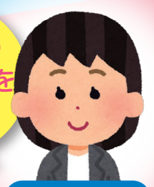
社会福祉士 しゃかいふくし