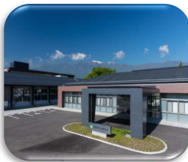
南信工科短期大学校