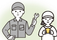
企業内で職業体験