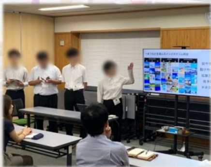
▲過去のインターンシップの様子

実際の仕事を体験できる5日間！ 交通費・宿泊費等を支給（条件あり）で参加しやすい