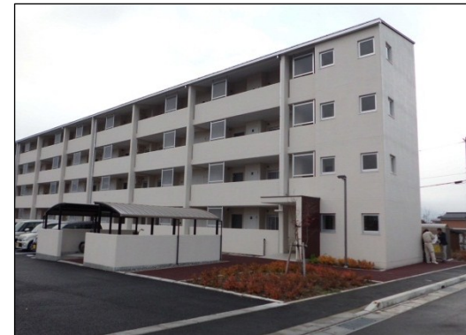
市営住宅敷地で、県営住宅の建替を実施