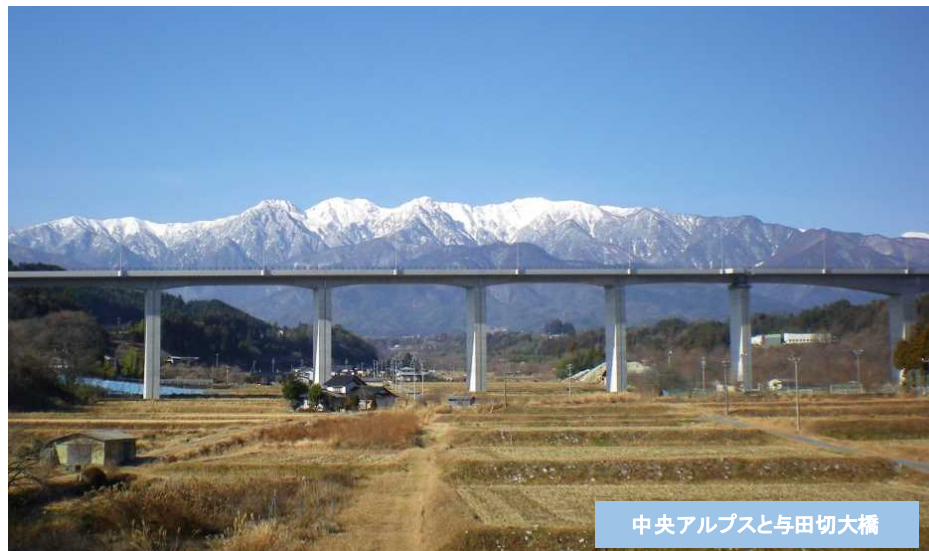
中央アルプスと与田切大橋

丘陵部はPC7径間連続ラーメン橋、与田切川渡河部は最大支間長140mのPC3径間連続ラーメン橋を採用し、橋脚高さと同支間長をバランスよく配置し、景観に優れる橋梁です。