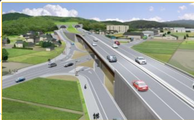
福島立体交差完成イメージ図