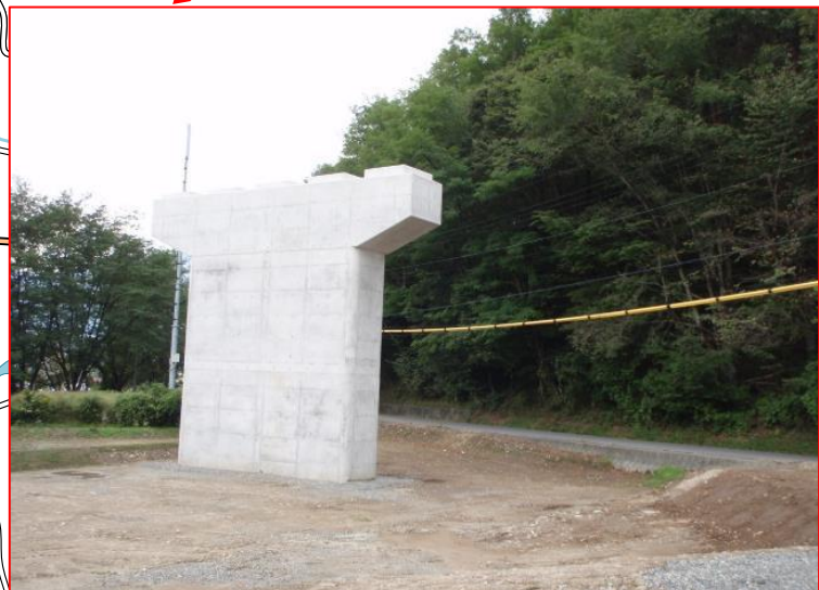
野底橋(仮称) 橋脚 (平成27年度施工)