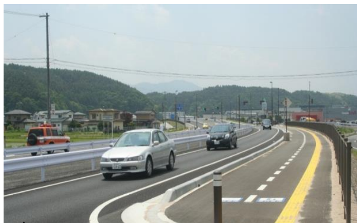
伊那バイパス利用状況