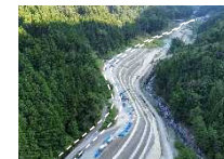
三遠南信自動車道関連道路整備 (国)152号 飯田市 小嵐バイパス