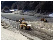
(一)松川 飯田市 松川ダム 貯水地内掘削状況