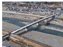
長寿命化計画等に基づくインフラ適正管理事業 (一)市ノ沢山吹(停)線 新万年橋