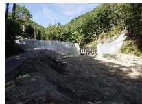
流域を保全する土砂災害対策事業 (砂)栗代川 阿智村 矢越