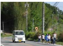
通学路等の交通安全対策推進事業 (一)親田中村線 飯田市 三穂