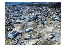
リニアを活かした交流圏拡大道路整備事業 (国)153号 飯田市 飯田北改良