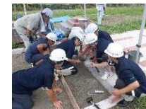
建設技術実践プロジェクト事業 「一級河川松川にOIDEなんしよプロジェクト」 (飯田OIDE長姫高校)

建設技術実践プロジェクト事業「一級河川松川にOIDEなんしよプロジェクト」(飯田OIDE長姫高校)