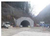
緊急輸送道路等の防災対策強化事業 (主)松川大鹿線 大鹿村 落合