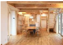
住宅オールZEH化推進事業 (飯田市内)