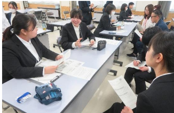
33名の先生方と次への一步

私自身が子どもたちの話を十分に 聞けて いないのかなと気づき ました。一人ひとりの様子を改め て観察し、子どもたちの思いや願 いを大切にしたいと思えます。