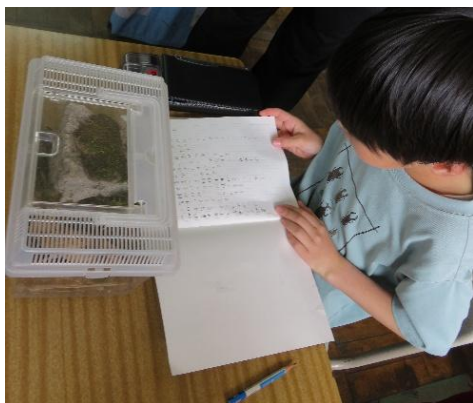
「マイタイム」でカナヘビの観察を始めた子ども

飯山市では「子どもたちの『学びたい』を大切に作る学校」を目指し、「3Csプロジェクト」に取り組みます。