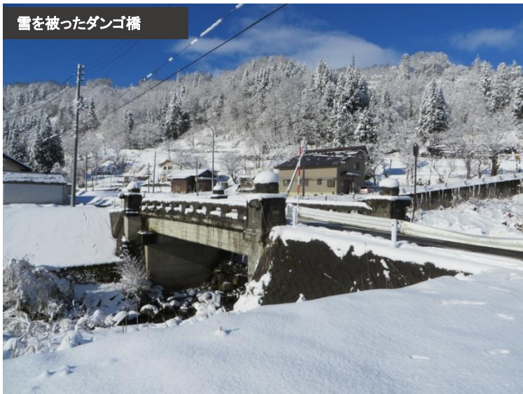
雪を被ったダンゴ橋