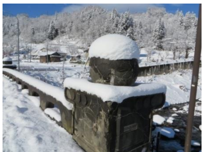
今なお残る、国道10号の銘板