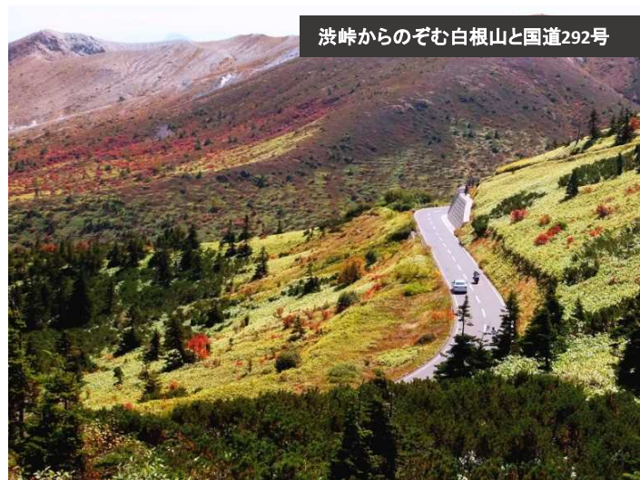
渋峠からのぞむ白根山と国道292号

標高2172mから見渡す志賀高原はまさに絶景で、多くのドライバーの方が四季の風景を楽しんでおります。(最高地点は群馬県)