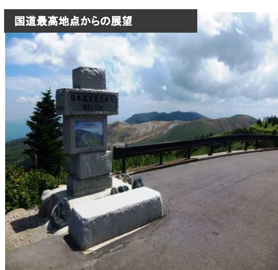
国道最高地点からの展望