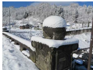
今なお残る、国道10号の銘板