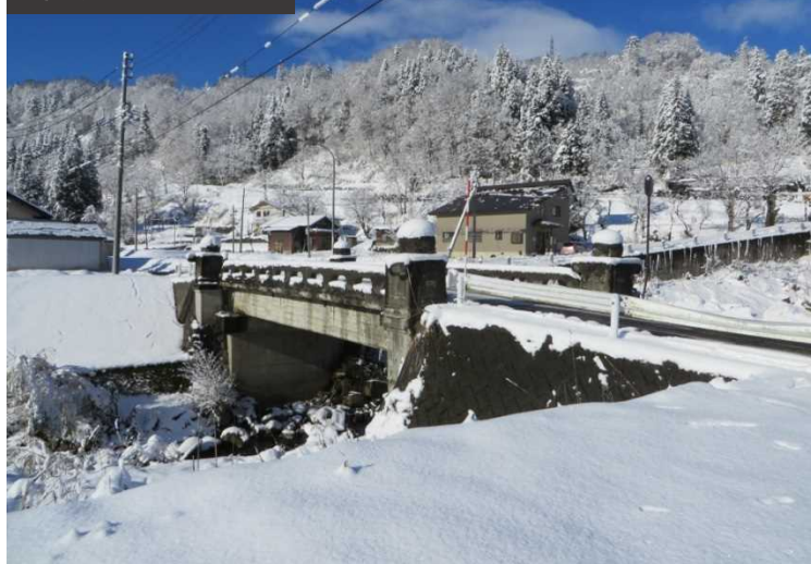
雪を被ったダンゴ橋