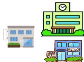
かかりつけ医療機能を担う医療機関