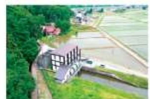
【湛水被害から農村を守る木島第一排水機場】