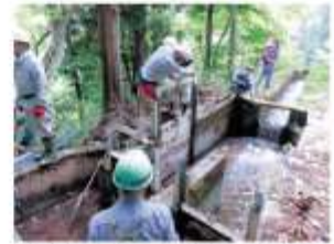
【地域ぐるみの水路保全活動】