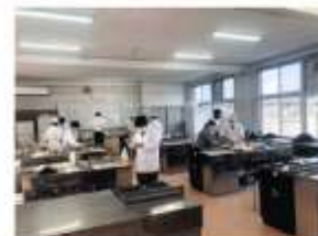
【高校生による伝統野菜のレシピ開発】