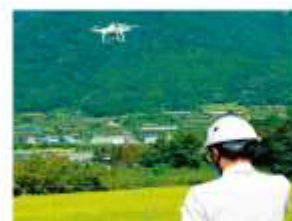
【農業用ドローンによるリモートセンシング】