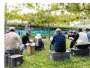
【クイーンルージュ ® の栽培検討会】