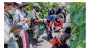
【北信州農業道場：先進農家に学ぶ】