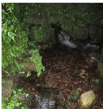
水道水源 (木島平村)