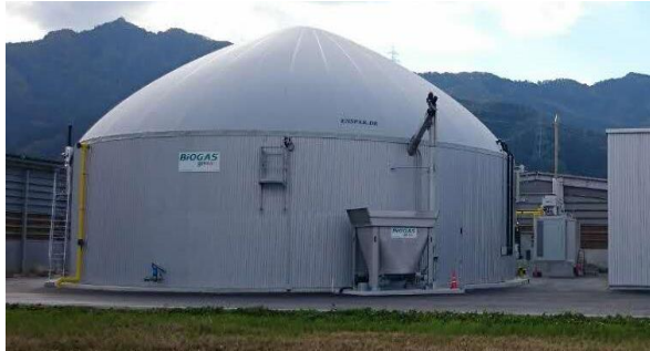
バイオマスガス発電所（中野市）

市町村や地元企業等が実施する再生可能エネルギーの導入事業に対して支援を行うとともに、豊かな環境づくり北信地域会議など関係団体と連携して再生可能エネルギーの普及拡大を推進している。