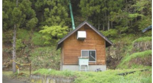
小水力発電所（木島平村）