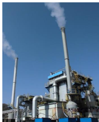
産業廃棄物焼却炉 (中野市)