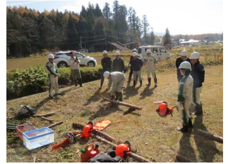
チェーンソー講習会