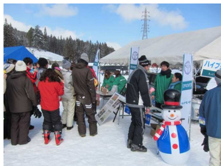
白馬岩岳感謝祭の中で森林整備棟の活動をPR