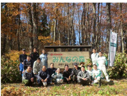
参加者全員で記念写真