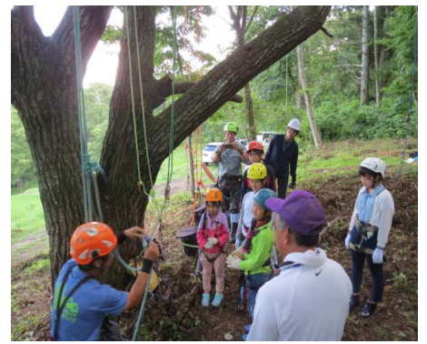
地元の方との交流