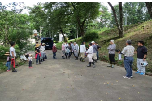
参加者へ作業内容を説明