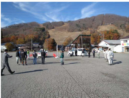
参加者へ作業内容を説明