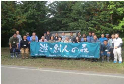
参加者全員で記念写真